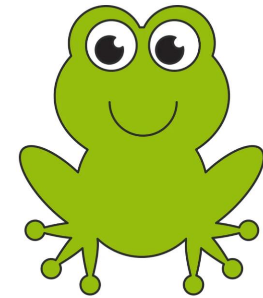
The Boiling Frog